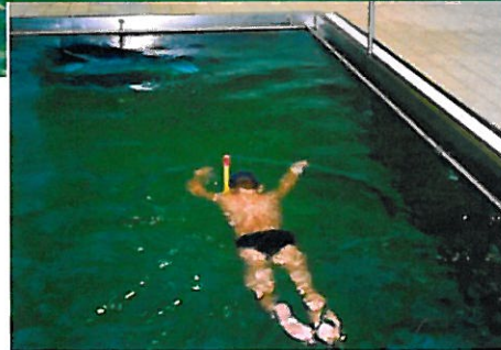
Prinzipdarstellung Strömungsbecken (Bernsteintherme Zinnowitz)